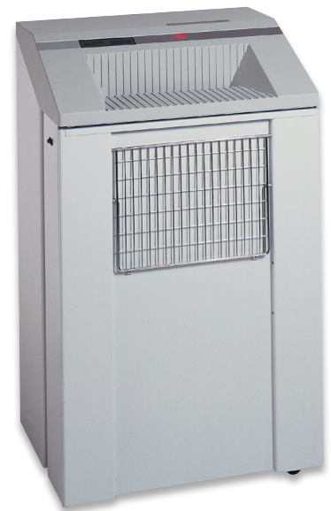
W/D/H 70 x 55 x 112 cm