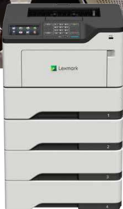
M3250 met optionele laden

Betrouwbaarheid. Beveiliging. Prestaties.