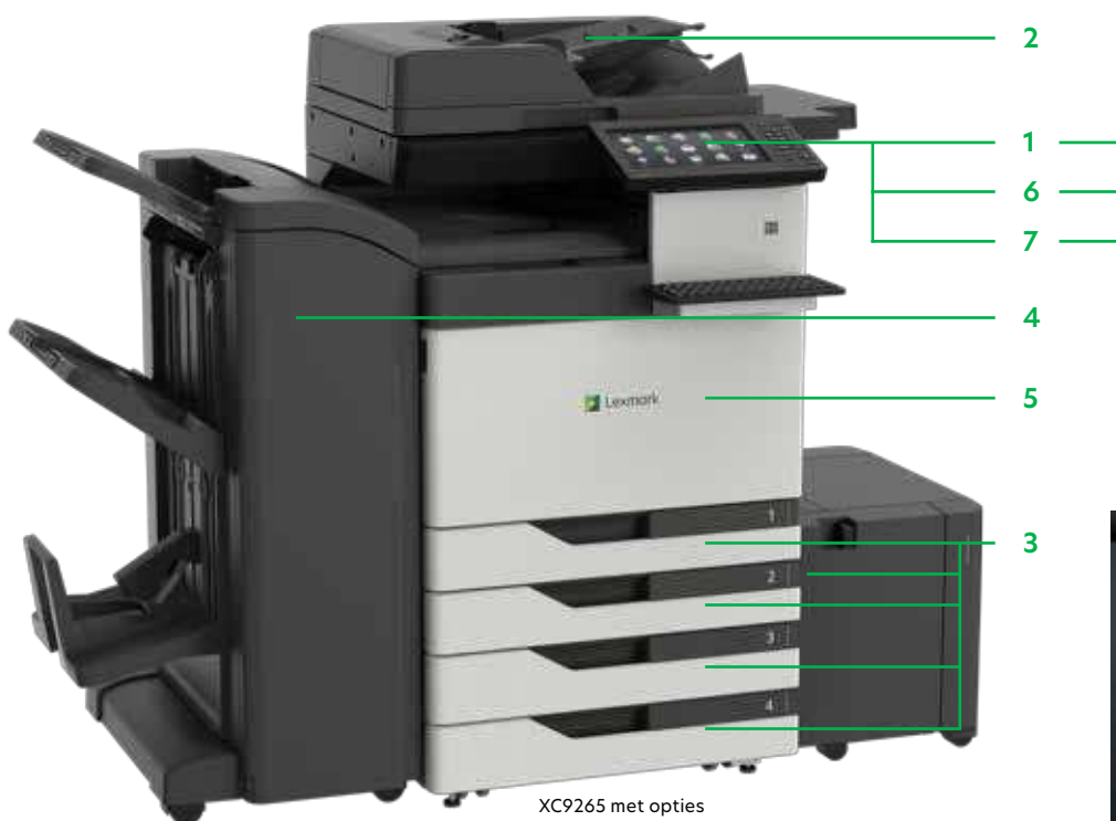
XC9265 met opties

Druk Microsoft Office-bestanden, PDF's en andere document- en afbeeldingstypen af vanaf flashstations, of selecteer documenten op netwerkservern of online stations en druk daarvandaan af.